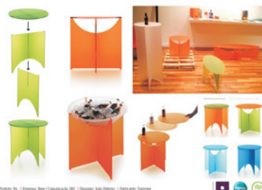
Criação: R. / Designer João Sérgio / Mercado Design

No segmento de móveis ainda foram premiados a cama com encosto reclinável da Faro Design, do Rio Grande do Sul e um sistema mobiliário da Dominox, de Minas Gerais.