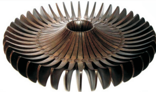
Fruteira Centopéia da Desfiacoco Design, do Paraná. A peça de design permite inúmeras possibilidades de formato e que seja utilizada nos dois lados, comportando-se tanto para frutas grandes quanto pequenas. Foi desenvolvido com materiais 100% recicláveis, à base de fibras naturais de coco, cana e madeira.